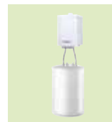
EMC-M / BS 80

A 55,4 cm L 36,8 cm P 36,4 cm 81 kg Bollitore: H 91,2 cm • Ø 57 cm